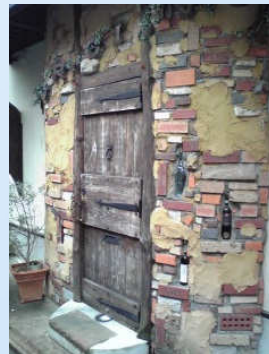
シェフがひとりで切り盛りする「ポルチーノ」の店先