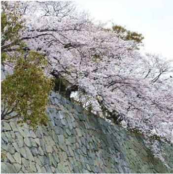
春は桜が咲き誇り花見の名所となる福岡城址（現舞鶴公園）。

さて、先月号に続いて、今月も警固界限です。ここは旧黒田藩のお膝元で、黒田長政公が福岡城を築城して以来、江戸時代を通して12代の藩主が居住していた一帯です。父黒田官兵衛と初代長政公はまるで正反対の性格だったようで、本能寺の変の知らせを聞いて驚く秀吉の耳元に「さあ、あなたの出番だ」と即座につぶやいた直感行動派の父官兵衛に対し、長政公は「異見会」という家老から下級武士までを集めた討論会を開いて部下の意見を広く聞くという慎重熟考派だったようです。また関ヶ原の戦の際に、小早川秀秋を東軍に寝返らせた長政公の働きに対し、徳川家康が手を握って感謝してくれたという話を父官兵衛にしたところ、官兵衛はそんな絶好のチャンスになぜ脇差しで家康を仕留めなかったのかと叱ったという、戦国時代らしいエピソードも残っています。