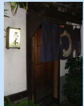
構えも店内も昔ながらの雰囲気な居酒屋「久米」