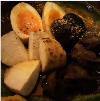
「おでん新乃」の黒おでんは濃い口の味付けで美味