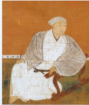
晩年は出家を目論み如水と号した黒田官兵衛高孝